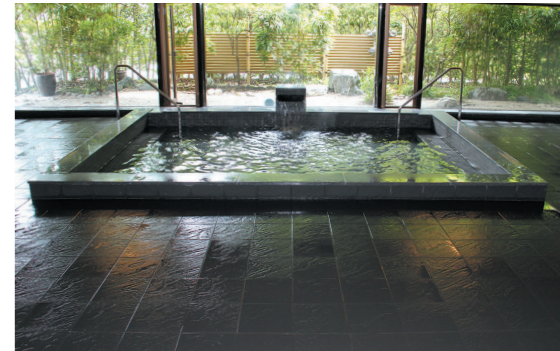
男・女浴室をリニューアルいたしました。