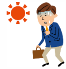
熱中症になったとき