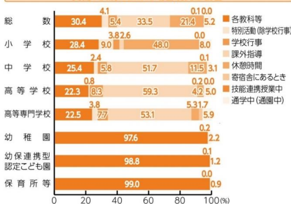
負傷・疾病における場合別発生割合