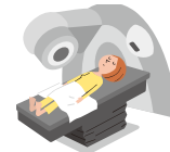
病気で放射線治療を受けたとき