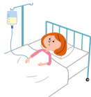
病気で入院したとき、病気で手術したとき 病気で入院後通院したとき